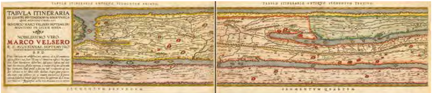
(Extrait) Le réseau du Cursus publicus nous est connu à travers La Table de Peutinger , copie du XIII ème siècle d'une ancienne carte romaine.