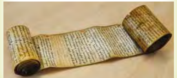
Cartulaire-rouleau de l'aumônerie Saint-Martial de Limoges (X e siècle)

Longtemps le système de portage fut réservé aux puissants et aux militaires. avant de devenir accessible aux religieux puis aux universitaires, qui avaient le service le mieux organisé au Moyen-Âge. Les monastères et les abbayes avaient pour particularité d'utiliser des coursiers appelés «porte-rouleau». Ces derniers emportaient les messages écrits sur un rouleau de parchemin (par-chemin) nommé «rotula», qui pouvait s'étirer sur plusieurs mètres de long puisqu'on lui ajoutait de nouvelles informations écrites tout au long de son parcours.