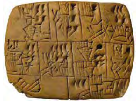
Tablette d'écriture précoce 3100-3000 av. JC

En Mésopotamie, 3000 ans avant JC, un soupçon de communication écrite apparaît dans un système de transfert de tablettes d'argile. Toutes les grandes civilisations ont organisé des systèmes d'échanges écrits. Ainsi, les Romains, ont mis en place le «vehiculatio», service impérial d'acheminement des informations du pouvoir vers tout l'Empire, principalement à destination des armées. Vers 30 avant JC, ce service devint le «cursus publicus». Des itinéraires sont alors cartographiés pour les coursiers, afin de répertorier les «points relais» comme on les nommerait aujourd'hui.